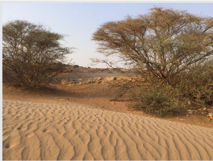
شجرات السمري في الوادي حول غدير خم، وقد خطب النبي صلى الله عليه وآله وسلم تحت شجرتي سمري