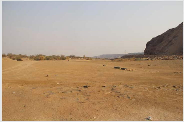
وادي الجحفة الذي يقع على شفيره غدير خم