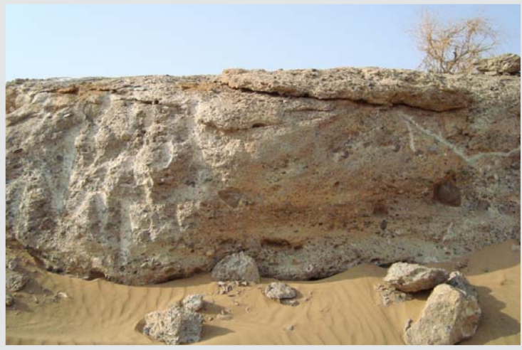
صورة قديمة لمكان الغدير بعد أن دفنه السيل