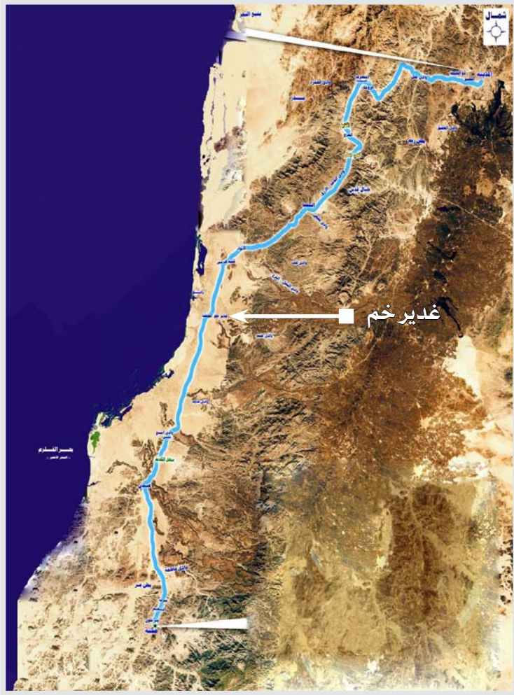
موقع غدير خم على طريق حجة الوداع