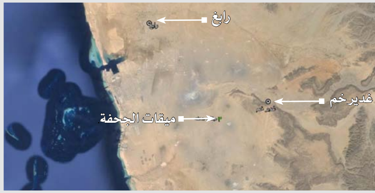
صورة جوية يظهر فيها غدير خم والجحفة