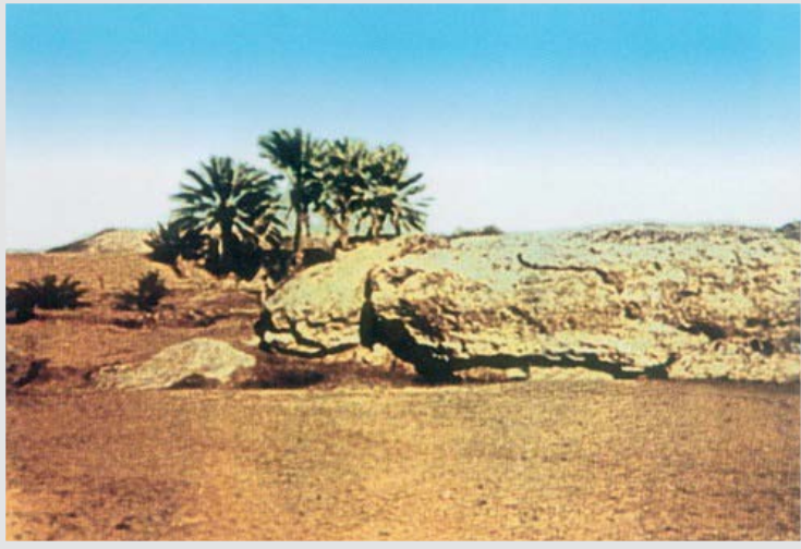
صورة قديمة لغدير خم