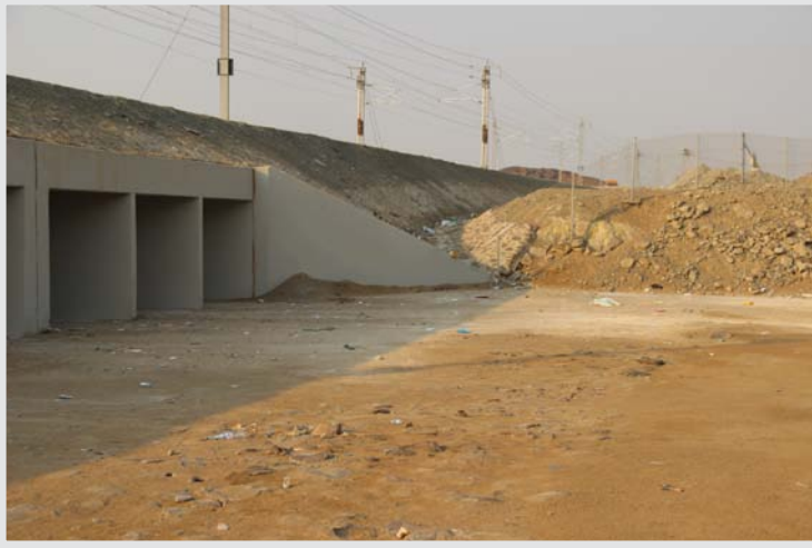
مكان الغدير على حافة جسر قطار الحرمين