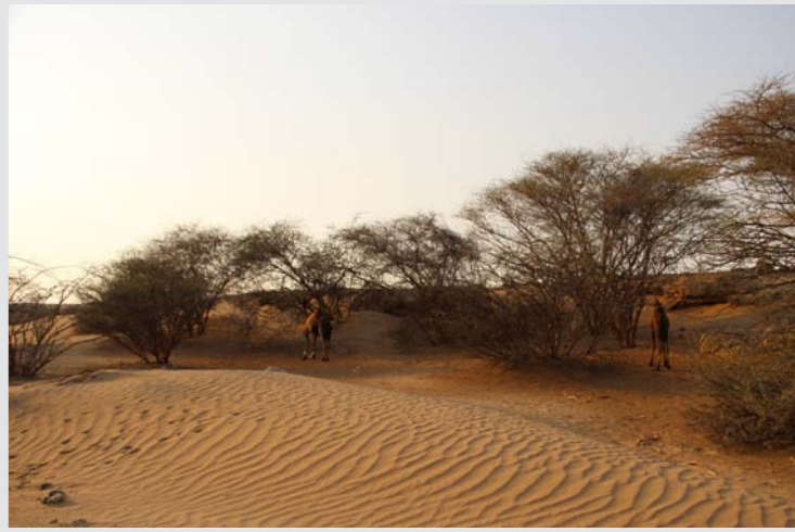
دوحات السمر حول غدير خم