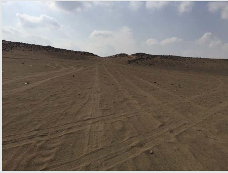
طريق القوافل القديم بين مكة والمدينة، ويسمى: طريق الأنبياء ويقع غدير خم شرق هذا الطريق