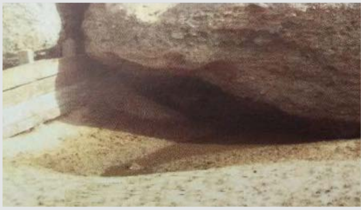
صورة قديمة لحوض الغدير