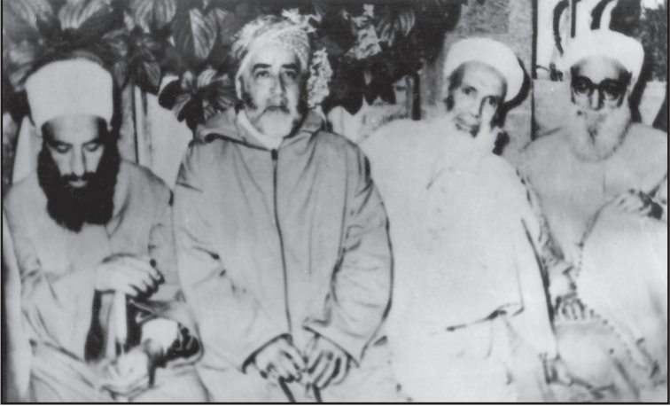
الشيخ إبراهيم الغلابيني وإلى يساره الشيخ أبو الخير الميداني وإلى يمينه الشيخ مكي الكتاني ثم الشيخ عبد العزيز عيون السود