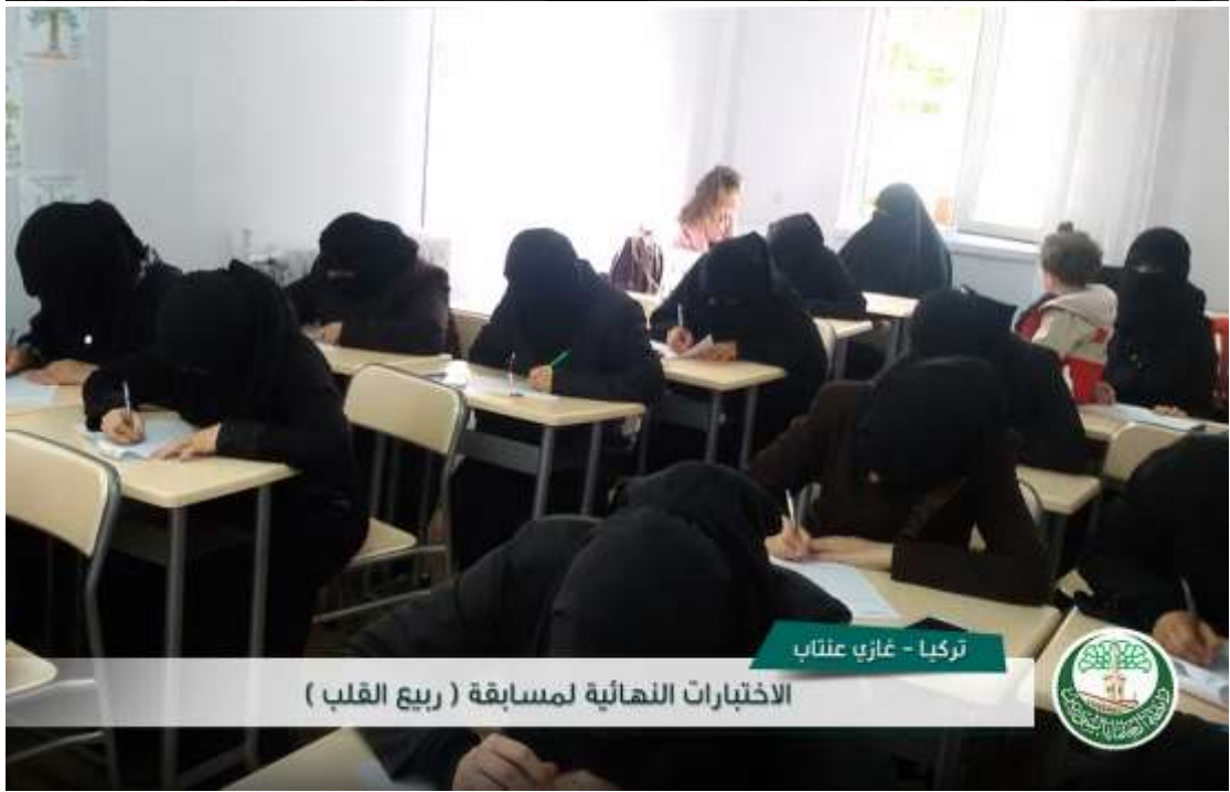
تركيا - غازي عنتاب الاختبارات النهائية لمسابقة ( ربيع القلب )

٣- تنفيذ إفطار جماعي مع أنشطة دعوية في خمس مراكز ومساجد للأخوات.