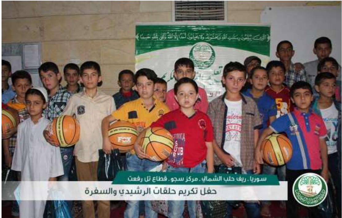
سوريا - ريف حلب الشمالي - مركز سجو - قطاع تل رفعت حفل تكريم حلقات الرشيدي والسفرة