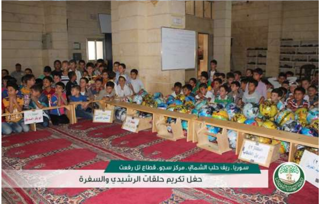
سوريا - ريف حلب الشمالي - مركز سجو - قطاع تل رفعت حفل تكريم حلقات الرشيدي والسفرة