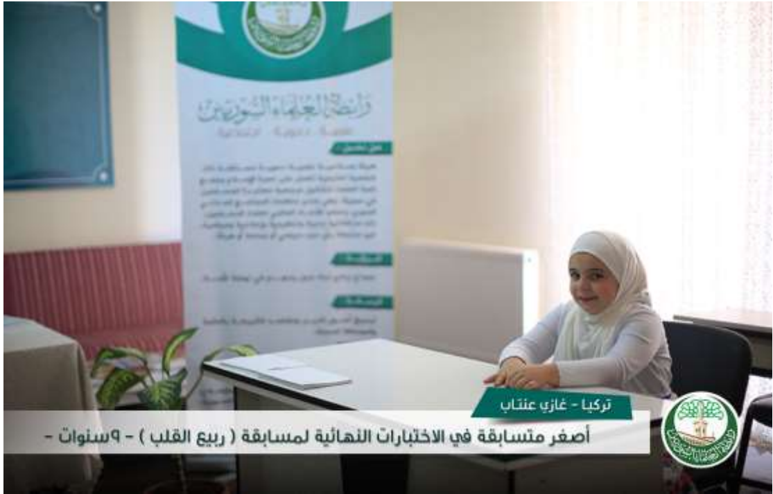
تركيا - غازي عنتاب أصغر متسابقة في الاختبارات النهائية لمسابقة ( ربيع القلب ) - ٩ سنوات -