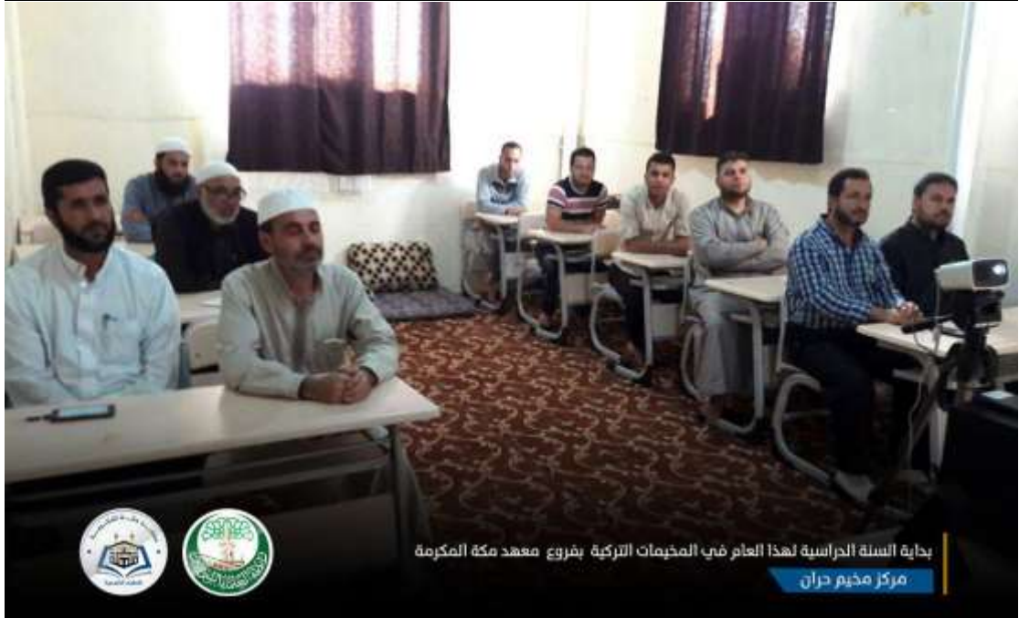
بداية السنة الحراسية لهذا العام في المخيمات التركية بفروع معهد مكة المكرمة مركز مخيم حران