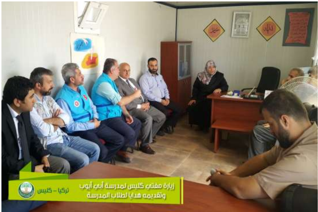
زيارة مفتية كليس لمدرسة أبيه أيوب وتقديمه هدايا لطلاب المدرسة تركيا - كليس