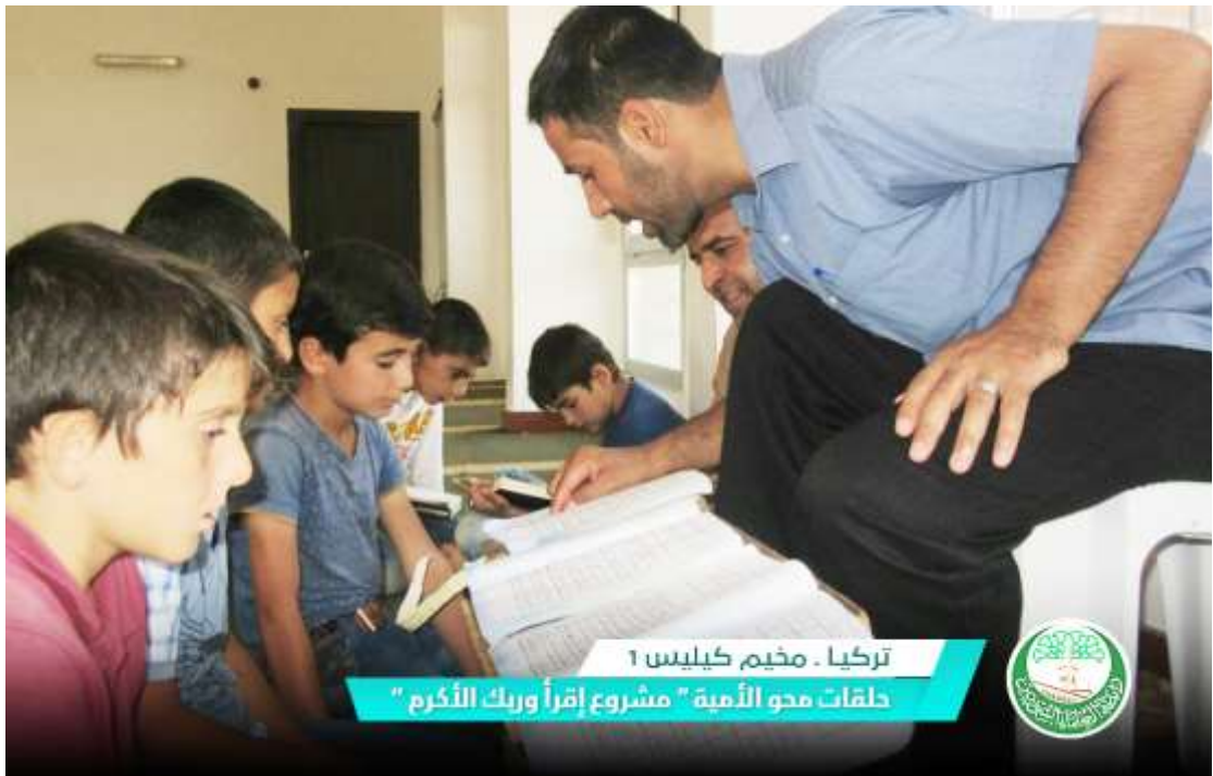
تركيا . مخيم كيليس ١ حلقات محو الأمية " مشروع اقرأ وريك الأكرم "