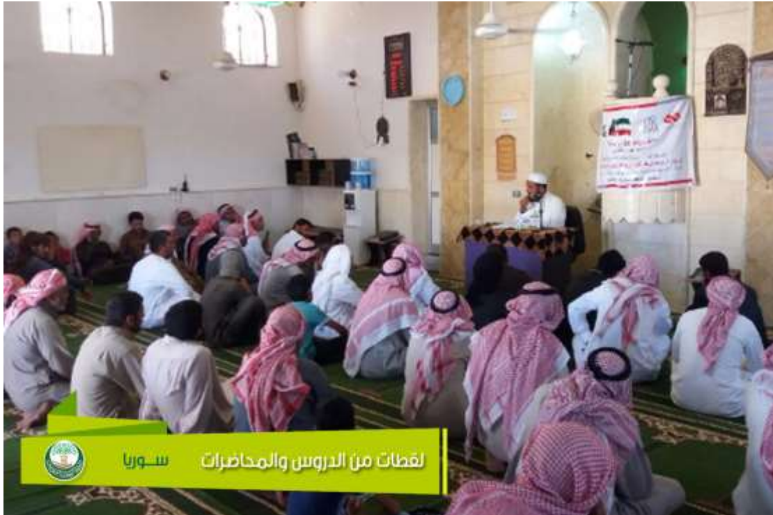
لقطات من الدروس والمحاضرات سوريا