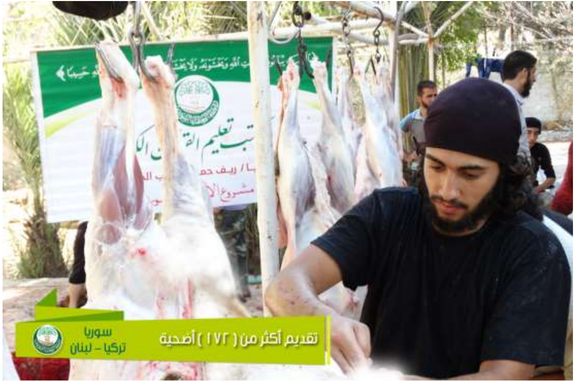
سوريا تركيا - لبنان تقديم أكثر من ( ١٧٢ ) أضحية