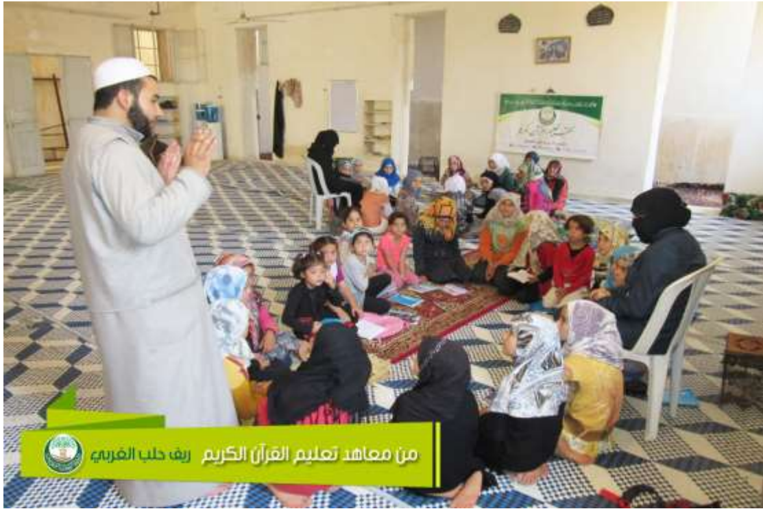
من معاهد تعليم القرآن الكريم ريف حلب الغربي