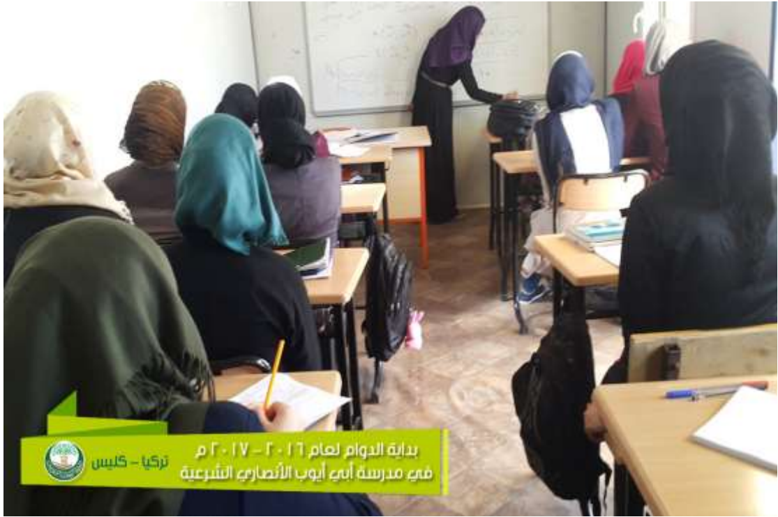
بداية الدوام لعام ٢٠١٦ - ٢٠١٧ م في مدرسة أبيه الأتصاحم الشرعية تركيا - كليس