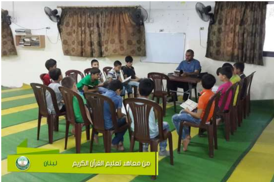
من معاهد تعليم القرآن الكريم لبنان