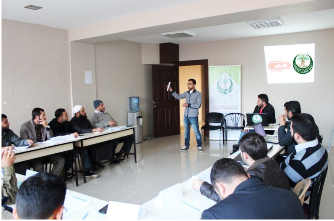
صورة لعرض السفراء مشاريعهم