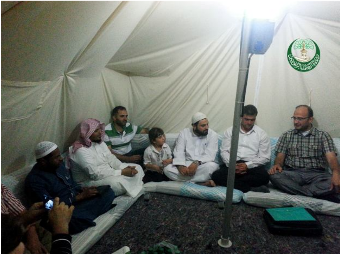
حفل زفاف بسيط لأحد معلمي القرآن الكريم في مخيم جيلان ببنار