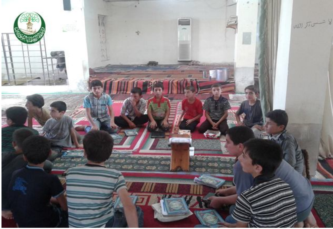
من حلقات التحفيظ في إدلب