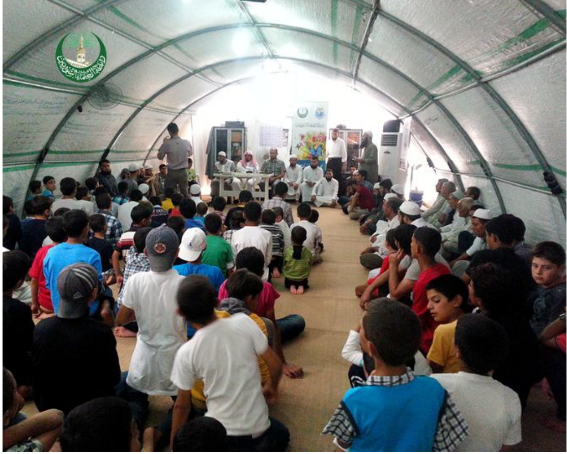
مسابقة الطالب المتميز في مخيم تل أبيض بحضور وفد من الهيئة العالمية ومشرف أورفا