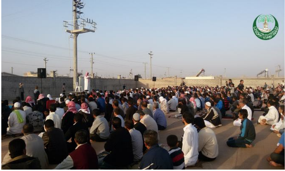
خطبة العيد في مخيم تل أبيض