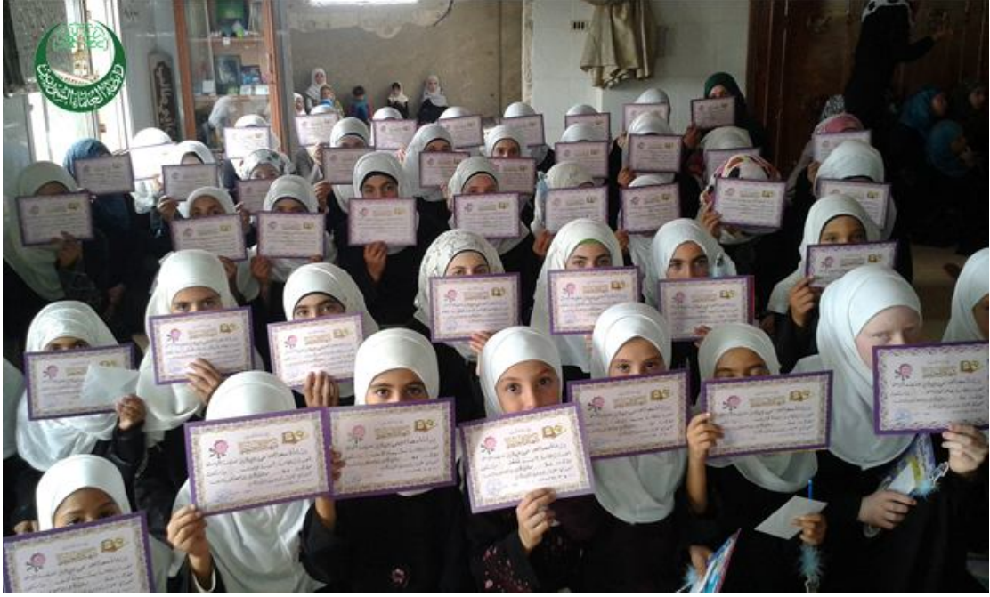
تكريم الطالبات في حمص