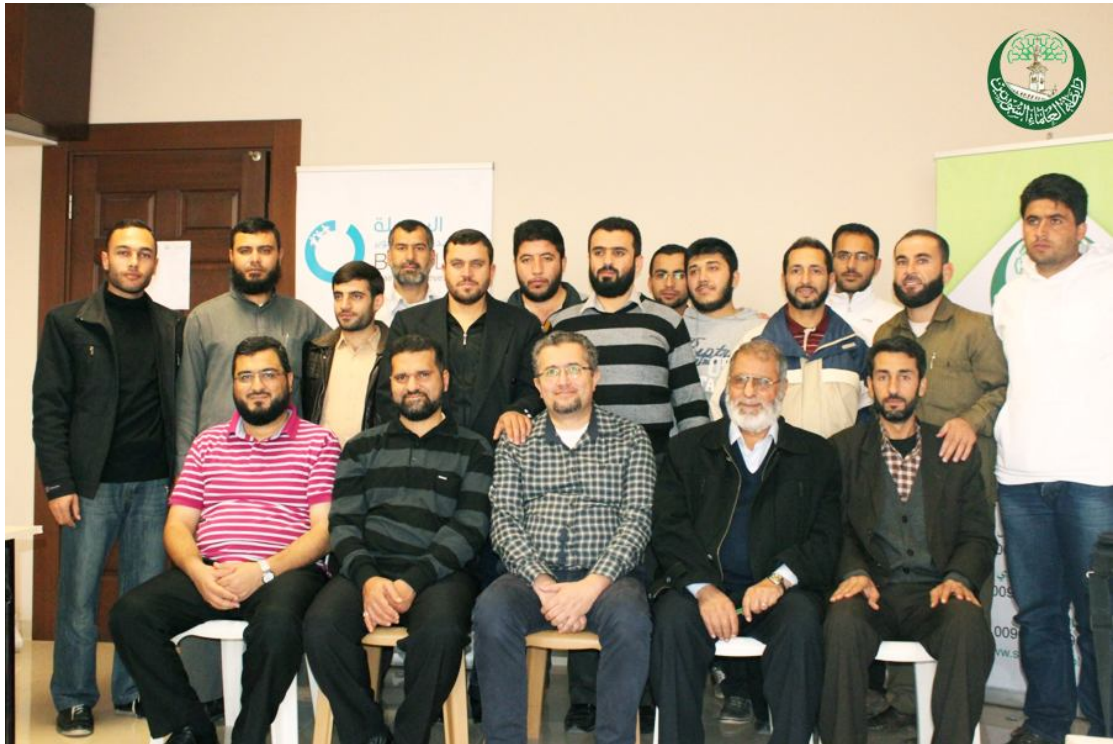
صورة لبعض المتدربين في الدورة