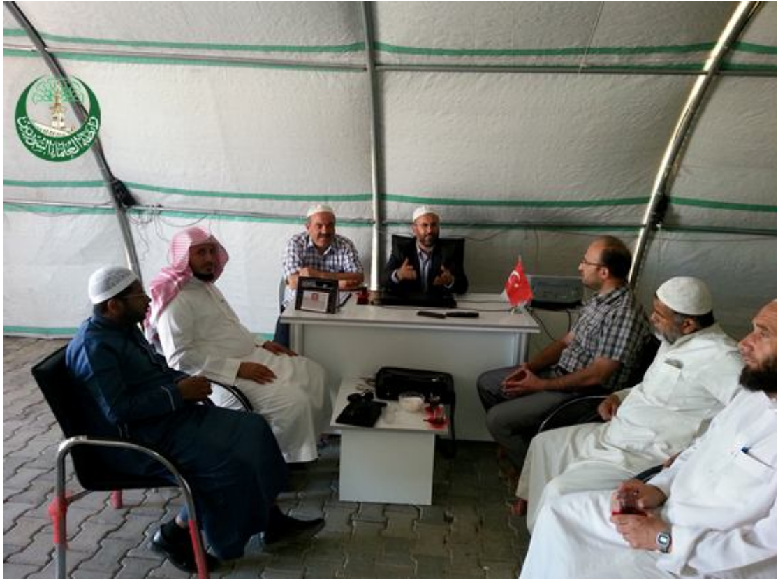
زيارة مشرف أورفا ووفد الهيئة العالمية لمسؤول الشؤون الدينية في مخيم فيران شهير