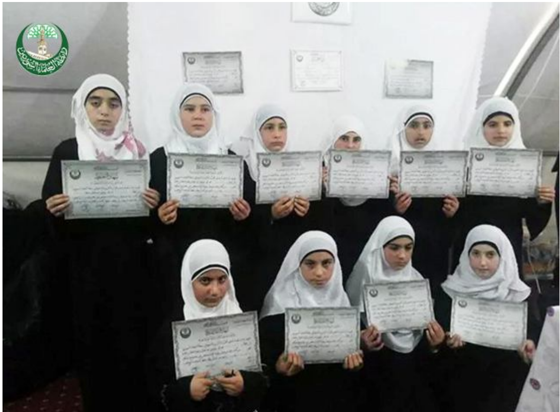
من حفل تكريم الطالبات في مخيم جيلان