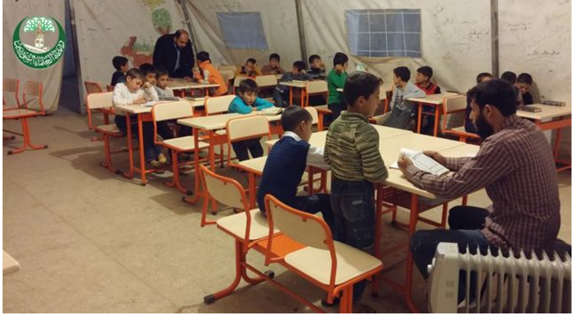
صورة للمشرف يسمع قراءة الطلاب ويقف على ضبطهم .. بحضور معلم الحلقة .