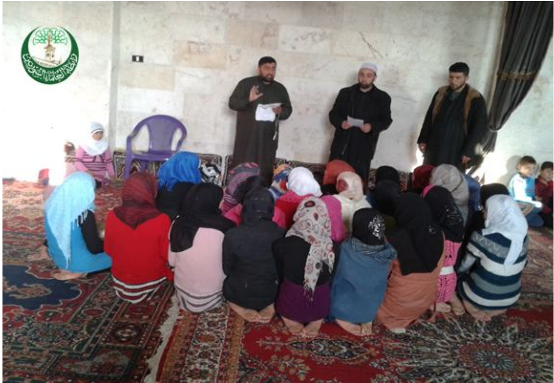
من المعاهد القرآنية في سوريا