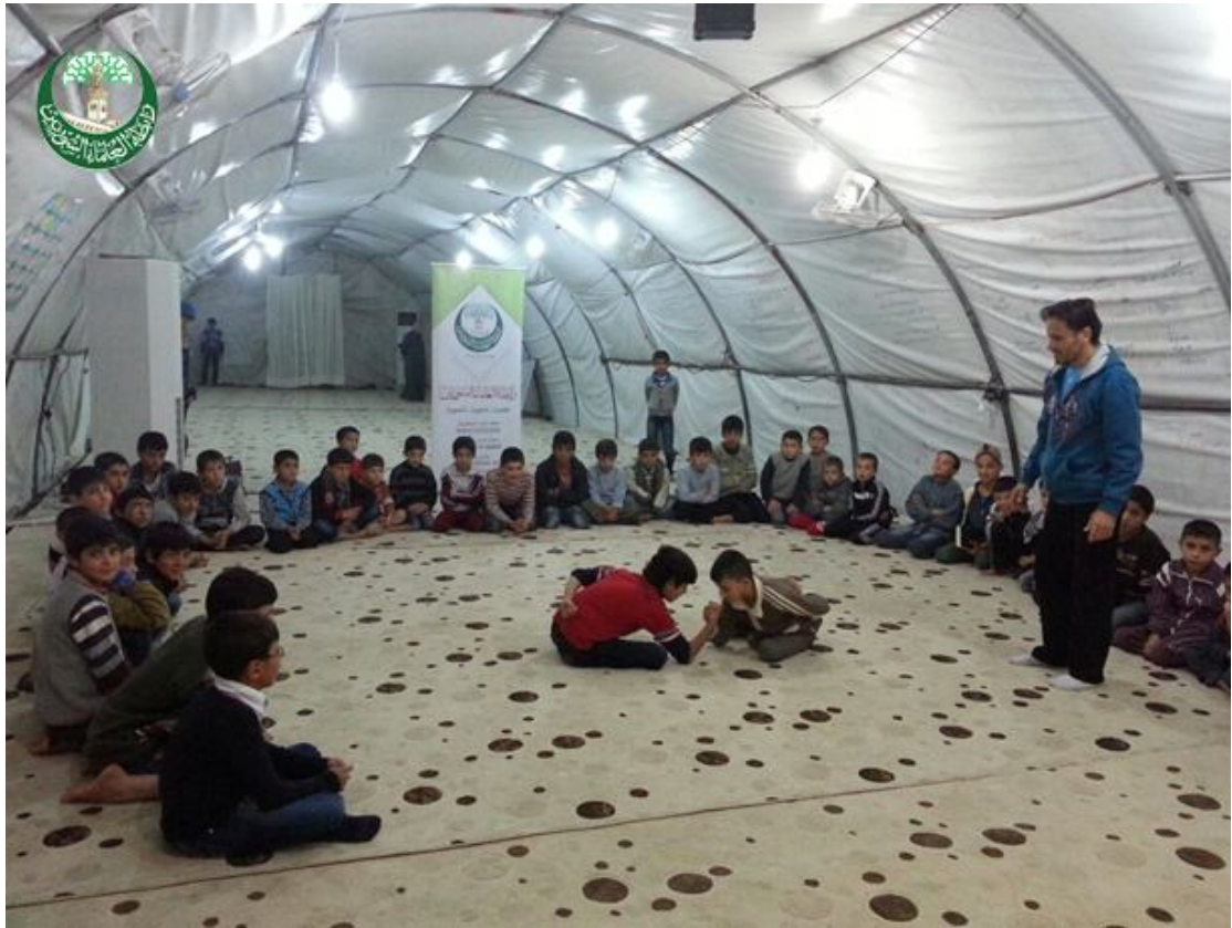
من أنشطة في مخيم قرقيش