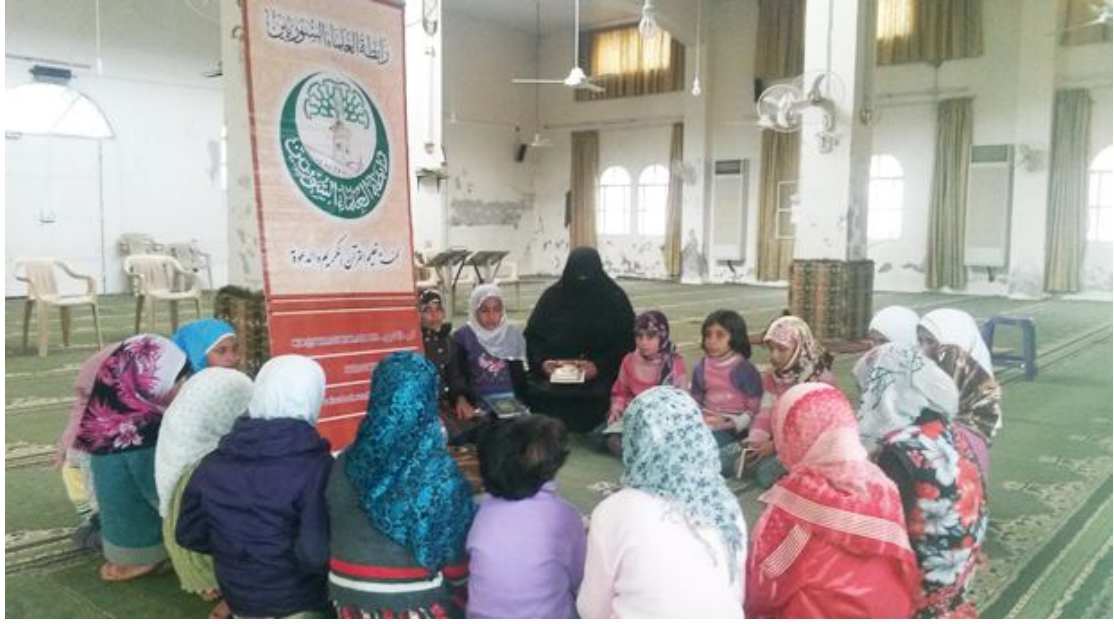
معهد البركات في سوريا