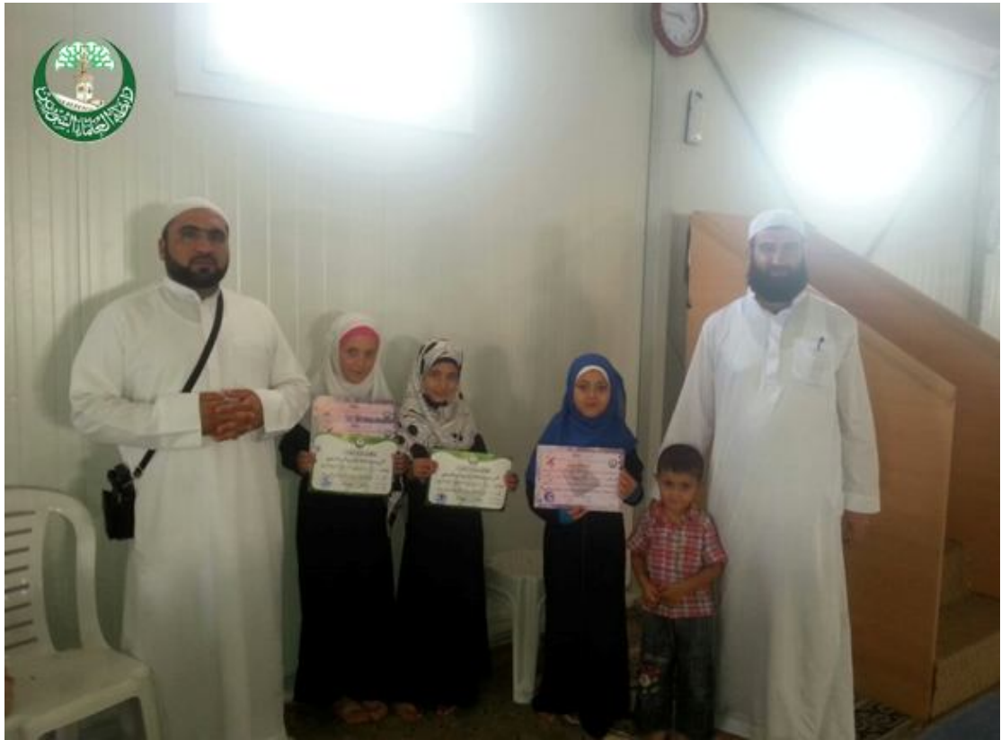
صورة تذكارية للمشرف مع الطلاب المتميزين تشجيعاً لهم وتحفيزاً