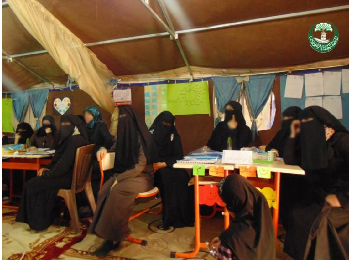
معلمات القرآن الكريم أثناء الدورة التدريبية الإبداع التعليمي منهجاً