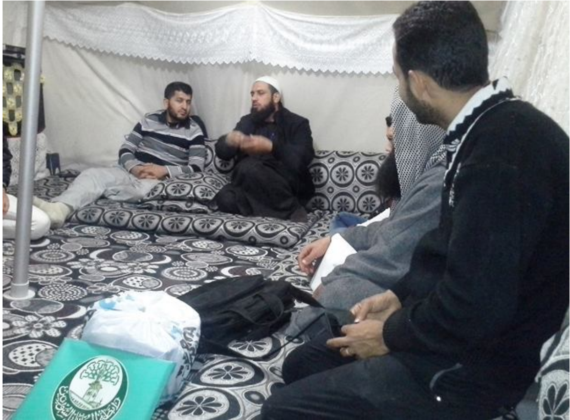
عيادة أحد معلمي القرآن بتل أبيض