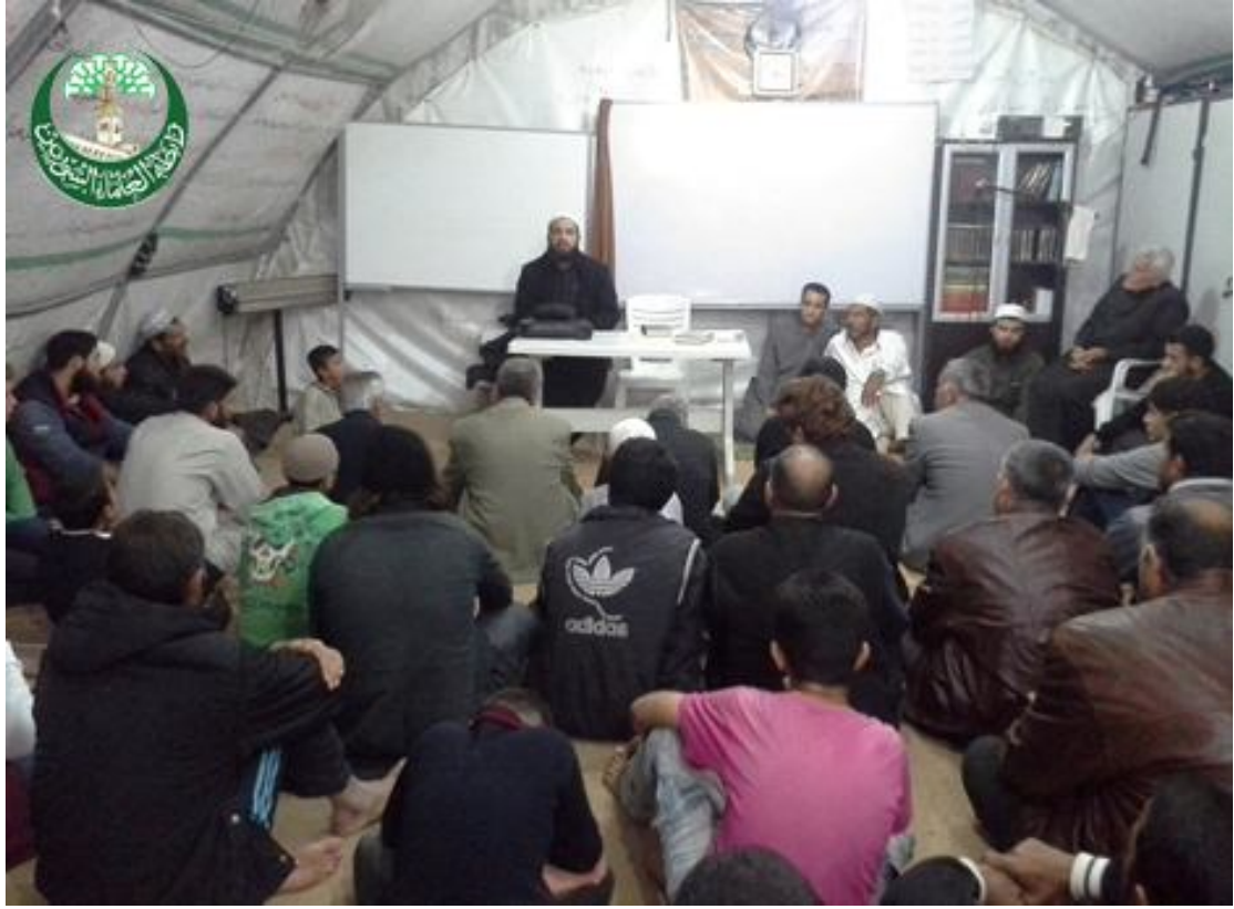
محاضرة مشرف تركيا في تل أبيب