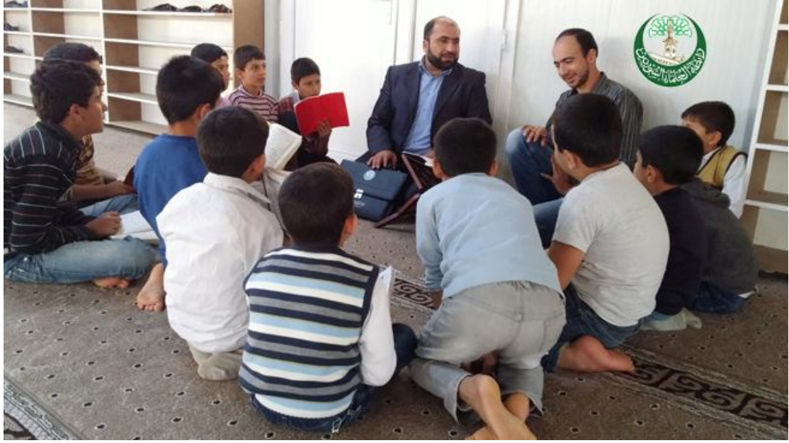
صورة تفقدية للمشرف في حلقة من حلقات مخيم الضباط يشكر المعلم على جهده المبذول