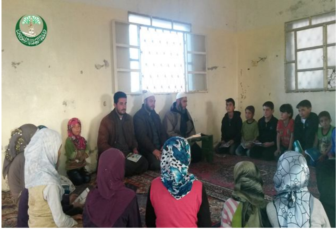
من المعاهد القرآنية في سوريا