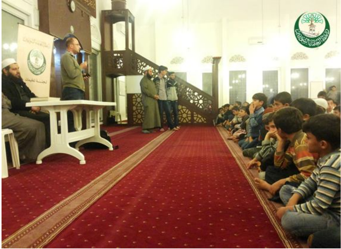
كلمة مشرف أورفا في حفل تكريم الطلاب بحران