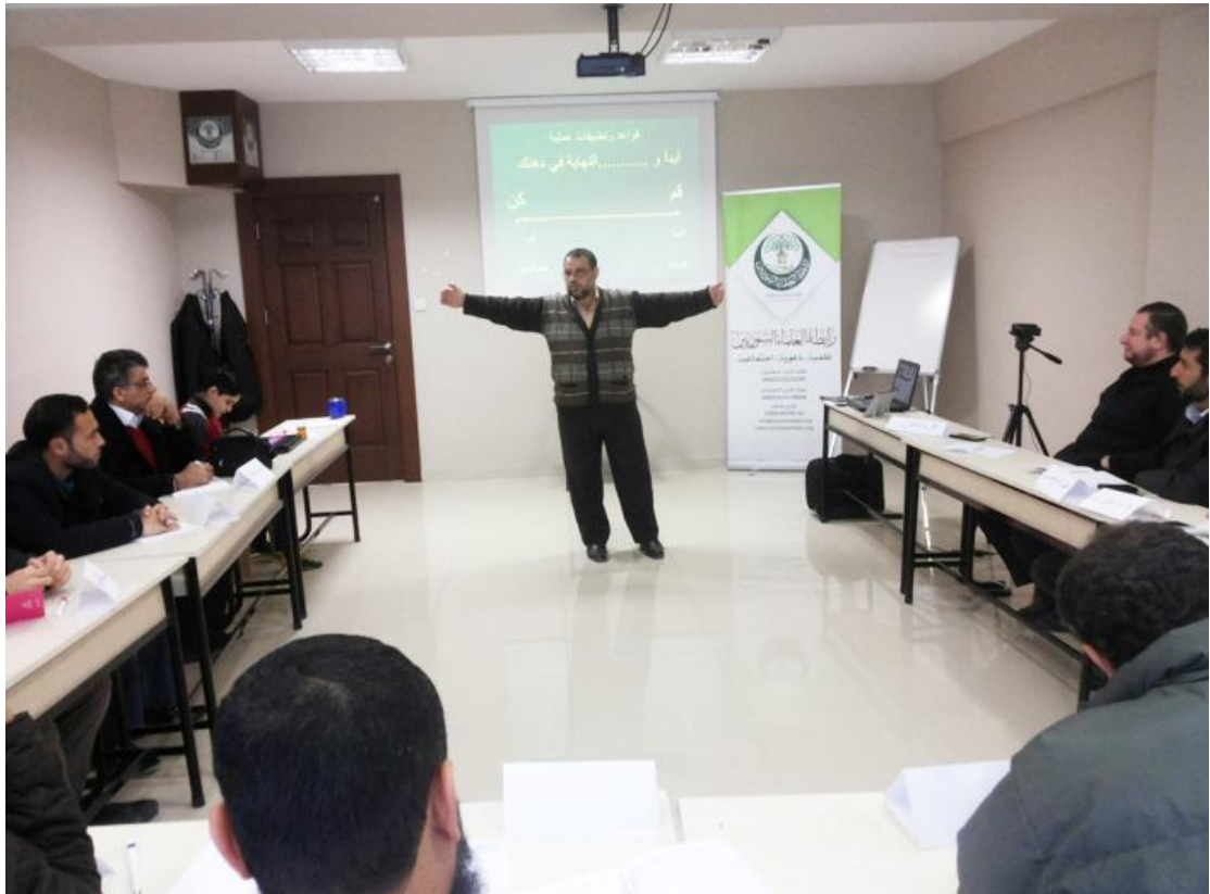
دورة كيف تدير حياتك بكفاءة مع المدرب الدولي الدكتور حمزة الحمزاوي