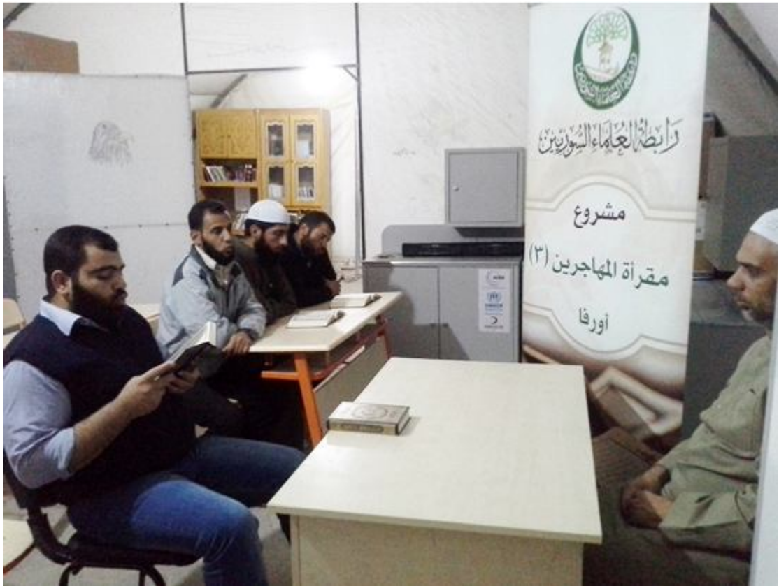
مقرأة أورفا في مخيم جيلان ببنار