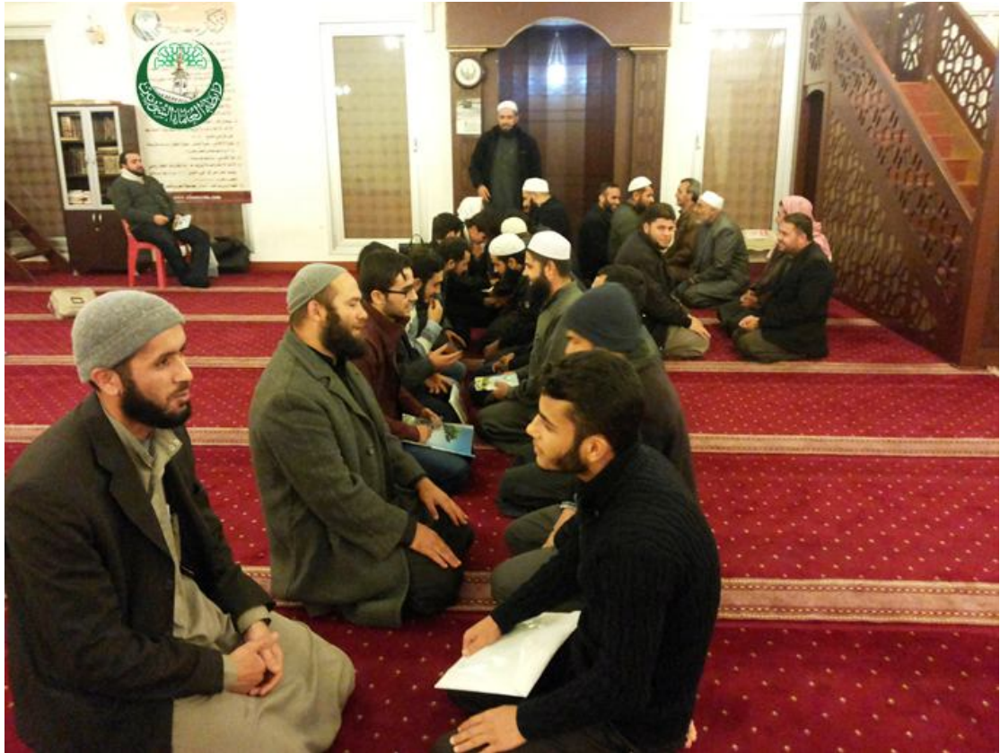
ورشة عمل في آلية اعطاء الدرس في مخيم حران