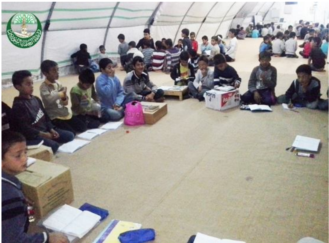
حلقات القرآن في مخيم تل أبيض