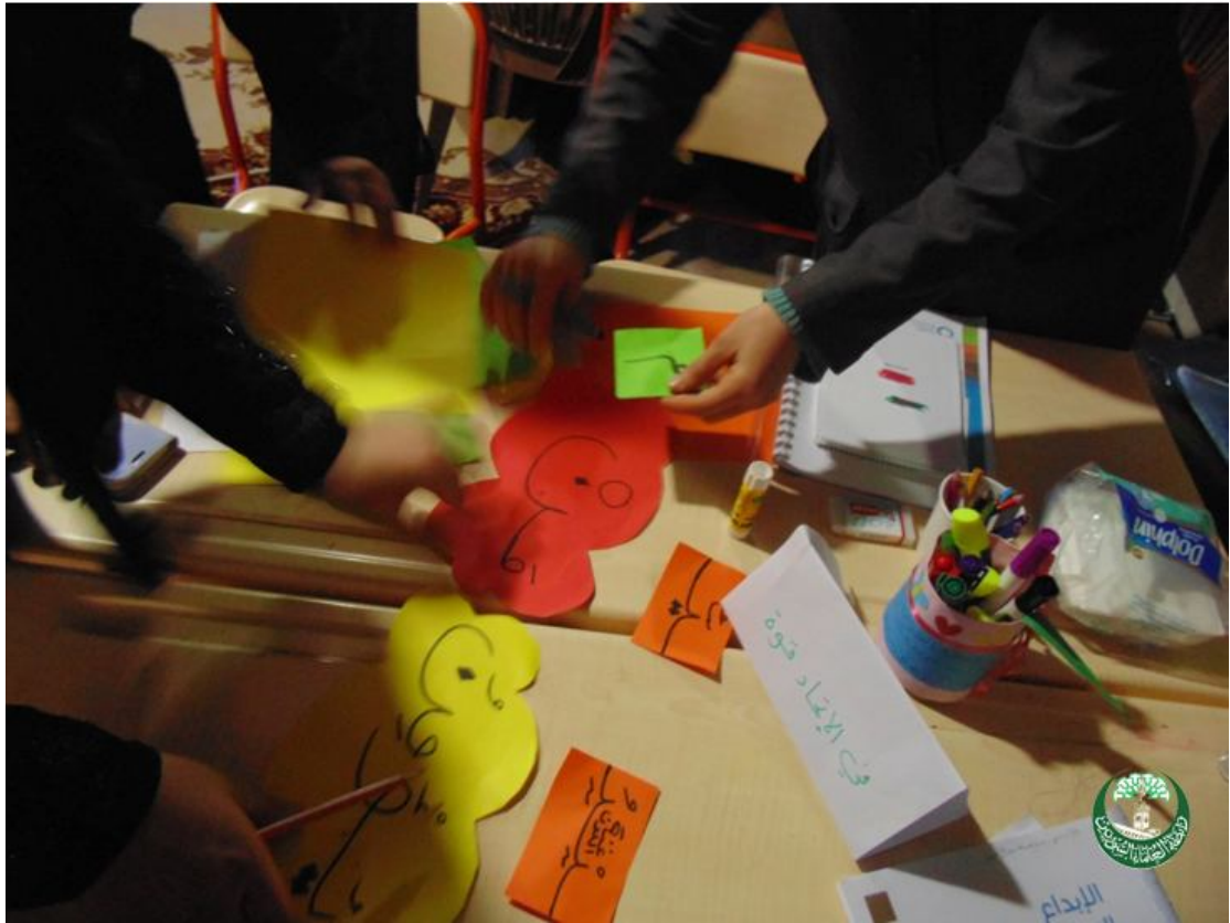
ورشة عمل وتدريبات عملية على الأنشطة الصفية الإبداعية