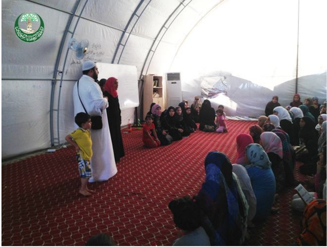
صورة تذكارية من المشرف مع الاخوات في اجتماع تفقدي توجيهي للحلقات الصباحية