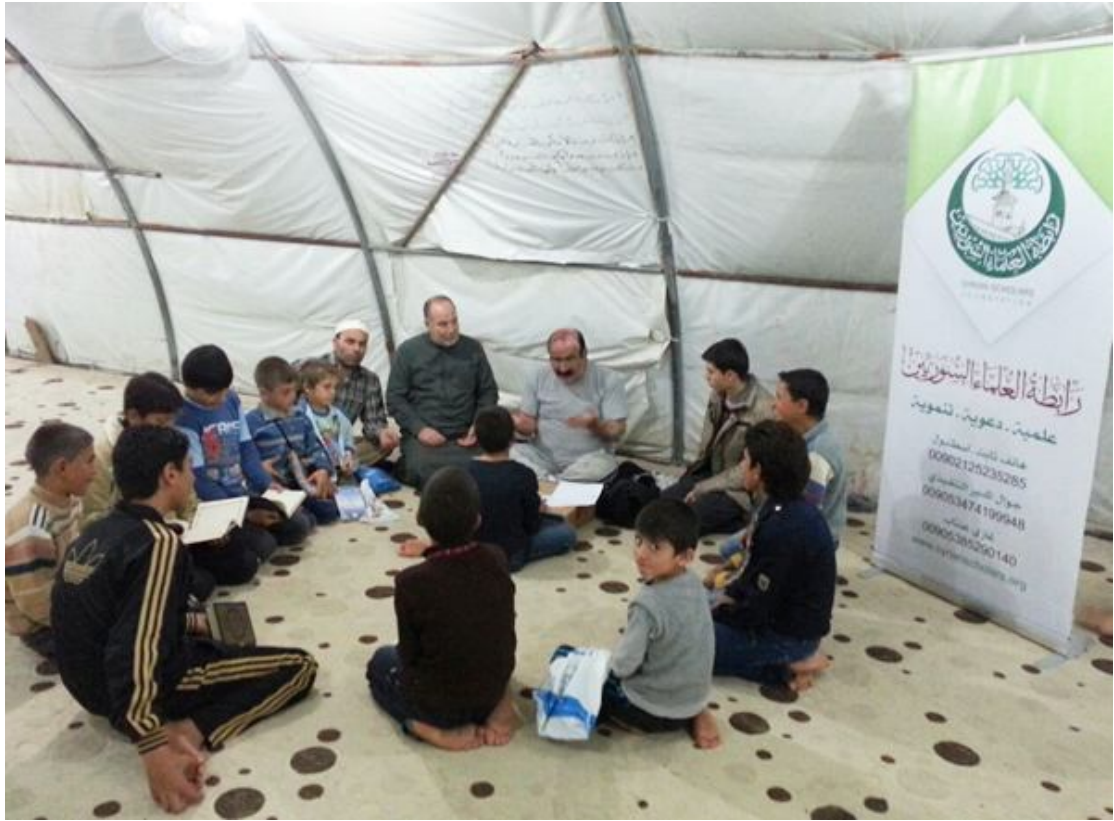
حلقة قرآن في مخيم قرقيش